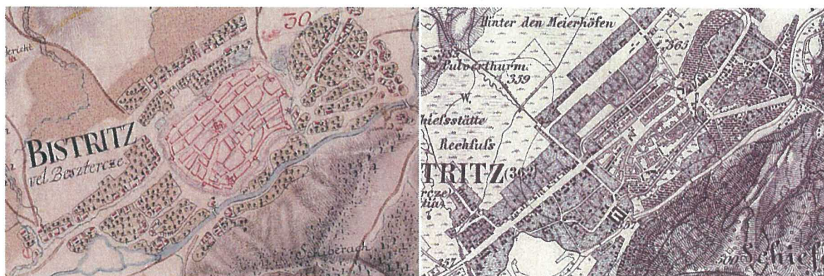
Figura 1. Evoluția nucleului istoric, municipiul Bistrița